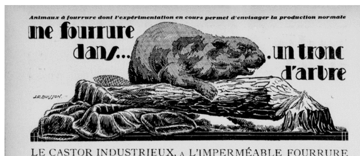
Extrait du journal La Vie à la campagne , 1930