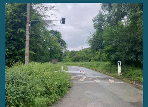
Système de barrière vétuste