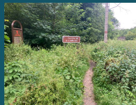
Entrée piétonne avant travaux