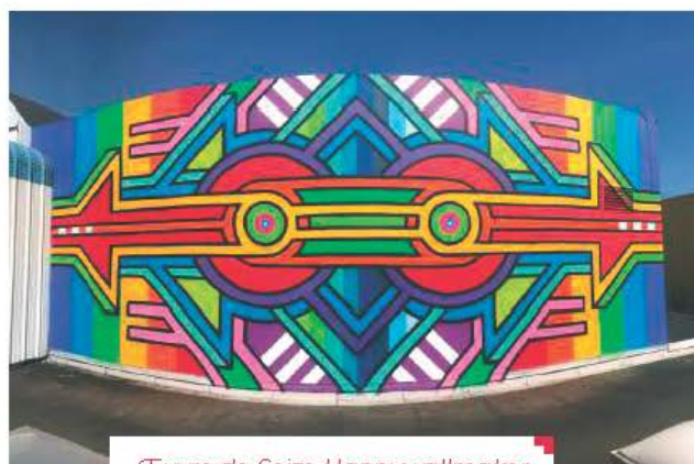
Œuvre de Seize Happywallmaker

Atelier créatif familial : sam. 5 avr. à 14h30- Renseignements et inscription au 01 88 10 01 58 ou orangerie@verrieres-le-buisson.fr