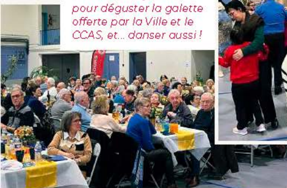
270 séniors réunis, dimanche 19 janvier, pour déguster la galette offerte par la Ville et le CCAS, et... danser aussi !