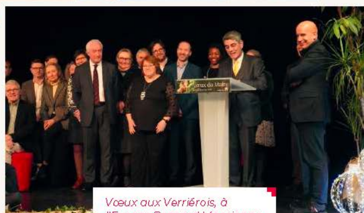
Vœux aux Verriérois, à l'Espace Bernard Mantiene, samedi 11 janvier