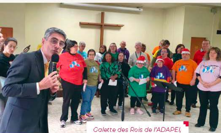
Galette des Rois de l'ADAPEI, samedi 11 janvier